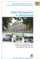
Umweltmanagement an Hochschulen. Bayerisches Staatsministerium für Umwelt, Gesundheit und Verbraucherschutz (Mai 2005)