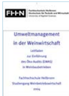
Umweltmanagement in der Weinwirtschaft. FH Heilbronn (April 2004)