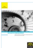
Öko-Audit in Landesbehörden. Umweltministerium Baden-Württemberg (Januar 2002)