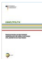
Umweltmanagement in der Landwirtschaft. Bundesumweltministerium und andere Autoren (April 2003)