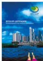
Umweltmanagement in der kommunalen Bauleitplanung. ECOLUP (März 2004)