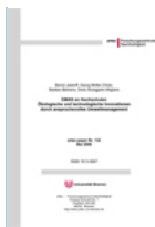
EMAS an Hochschulen. Tagungsband. Forschungszentrum Nachhaltigkeit (artec) der Universität Bremen (Mai 2006)