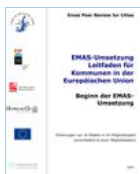
EMAS-Umsetzung, Leitfaden für Kommunen in der europäischen Union. EU-Kommission und weitere Hrsg. (2004)