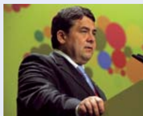
Sigmar Gabriel, Bundesminister für Umwelt, Naturschutz und Reaktorsicherheit und gewählter Präsident der 9. Naturschutzkonferenz bei seiner Eröffnungsrede

Auf der Konferenz zur Biologischen Vielfalt in Bonn vom 12.–30.05.2008 wurde nicht nur über Umweltschutz diskutiert, sondern dieser auch praktiziert. Dies bestätigt auch die erfolgreiche Validierung der 9. Vertragsstaatenkonferenz zur Biologischen Vielfalt (CBD) und der 4. Tagung der Vertragsparteien des Cartagena Protokolls über die biologische Sicherheit nach EMAS. Für die EMAS-Teilnahme wurde ein umfassendes Umweltkonzept entwickelt, das einen Standard für zukünftige Veranstaltungen dieser Größe darstellt.