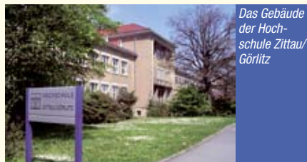
Das Gebäude der Hochschule Zittau/Görlitz