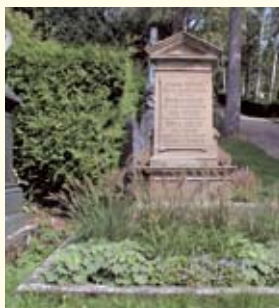
Staudengrab im Tübinger Stadtfriedhof

Tübingen bemüht sich sehr, den Artenreichtum in den Friedhöfen zu erhalten und zu fördern. Dies wurde jetzt geehrt. Als Projekt des Monats März 2008 des Wettbewerbs „Grün in der Stadt“ der Deutschen Umwelthilfe e. V. (DUH) sind die Friedhöfe der Universitätsstadt ausgezeichnet worden. Die DUH lobt jeden Monat ein Projekt aus, das ökologisches Grünflächenmanagement auf beispielhafte Weise verwirklicht. Auch das Umweltmanagementsystem des Friedhofswesens in Tübingen, das als erstes seiner Art in Deutschland seit 2003 EMAS validiert ist, wurde ganz auf die Wertschätzung der Friedhöfe als Naturflächen in der Stadt ausgelegt. Auf insgesamt 13 Friedhofsanlagen mit einer Gesamtfläche von ca. 27 ha und 14.500 Gräbern wird umwelt- und ressourcenschonend gewirtschaftet, um der Flora, Fauna und den Besuchern Ruhe und Erholung zu bieten. Vor allem die heimischen Baum- und Straucharten sollen er-